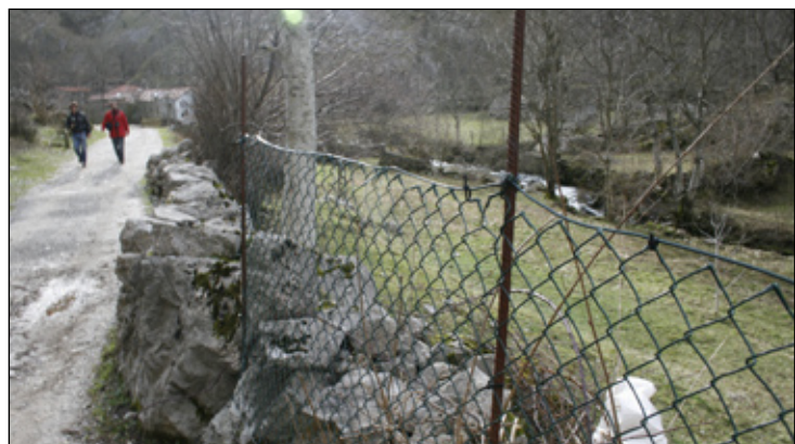
Uno de los cierres que hay en una de las fincas a la entrada de Bulnes.

Bulnes después de pagar una pasta por utilizar el funicular?, praos cerrados con varillas de tetrace-ro, de las utilizadas para encofrar, y malla impropia de un espacio protegido; somieres haciendo de portillas..., que denotan poco compromiso por parte de los vecinos; pero también poco interés de los responsables de Parques que lo permiten. ¿Por qué no una partida económica también para subsanar esta situación incompatible que atenta contra la filosofía de lo que debe ser un Parque Nacional?