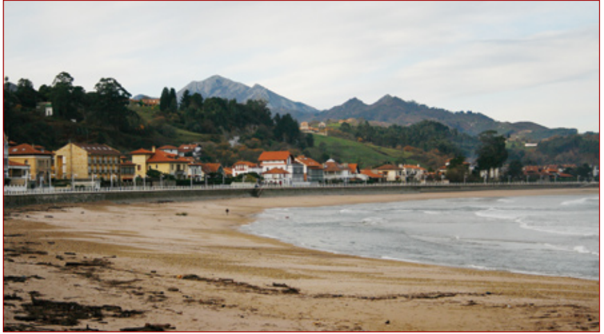
Arriba, la playa urbana de Ribadesella, que es un lugar idóneo para pasear tanto en verano como en invierno. Debajo, la Playa de Vega, de cuya arena brota una fuente de agua dulce.

En cuanto a la playa de Vega, se encuentra en la localidad del mismo nombre. Es la más extensa de todas y está catalogada como "Monumento Natural" por sus acantilados y huellas de dinosaurio.