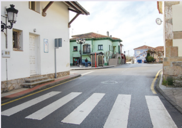
El Camino de Santiago atraviesa la capital del concejo de Sariego, Vega.

E l territorio saregano está incluido en uno de los itinerarios de lo que, en la peregrinación a Santiago de Compostela, se ha dado en llamar «Camino Francés». Desde Valdediós los peregrinos seguían por Sariego, continuaban por Siero hasta llegar a Oviedo, donde solían hacer un alto para visitar y orar en la Iglesia de San Salvador. Desde hace siglos, Sariego ha sido paso obligado de peregrinos y viajeros. La