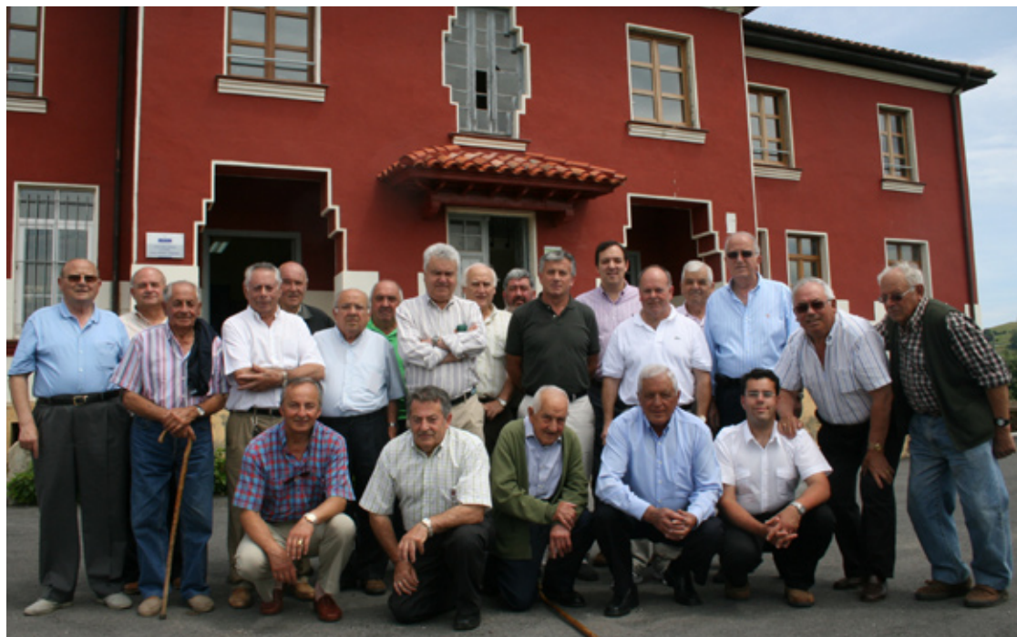
Antiguos alumnos de la escuela de Torazu, con el alcalde de Cabranes, el pasado sábado.

“Ningún descubrimiento se haría ya si nos contentásemos con lo que sabemos” Lucio Anneo Séneca