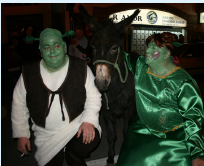
Cangas fue Disney por un día. En la imagen, «Manolo Srek» y «Fiona Mole», dos de los personajes de la carroza de Disney, que desfiló el sábado por las calles de Cangas de Onís. Pág. 7

financiarán con cargo al Programa Leader. Los socialistas apuestan por llevar a cabo proyectos que redunden en la mejora del ámbito rural del concejo.