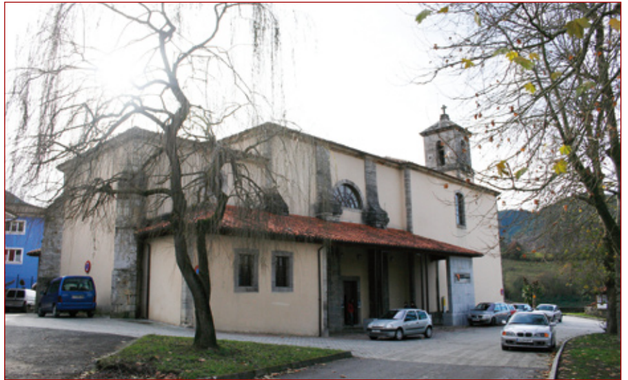
La Iglesia de Cangas de Arriba acoge en su interior en Aula del Reino de Asturias.

C angas de Onís es un municipio noble, en el que se asentaron diversos reyes de la Monarquía Asturiana. La antigua iglesia de la ciudad, ubicada en el barrio de Cangas de Arriba, acoge el Aula del Reino de Asturias. En un edificio de gran valor arquitectónico, que aún conserva una cabecera del siglo XV, este equipamiento cultural sumerge al visitante en un recorrido por la historia de la Monarquía Astur, deteniéndose que aquellos reyes que asentaron su corte en Cangas de Onís. El Aula del Reino está dotada con paneles explicativos, material audiovisual y una maqueta virtual en la que se aproxima al visitante al alcance y la importancia que tuvo la Monarquía Asturiana en la historia de España. Además, se puede contemplar una exposición de objetos de la época, comprendida entre los siglos XIII y X.