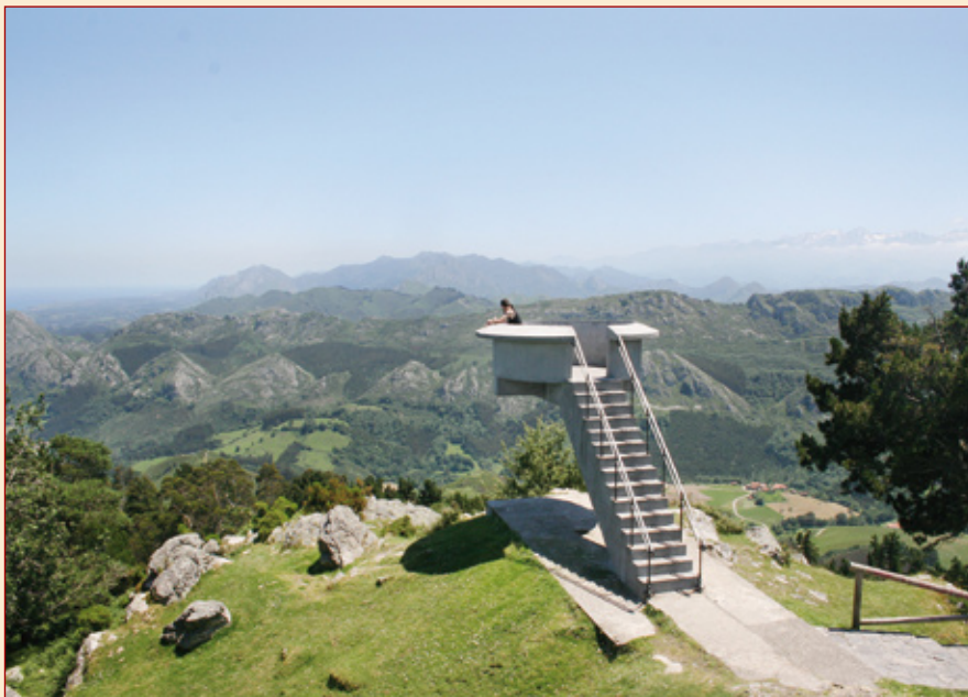
Desde el Mirador del Fito se contemplan unas panorámicas únicas de la montaña y la costa asturiana.

A escasos 20 kilómetros del litoral cantábrico, el paisaje parragués contiene joyas como la Tejada del Sueve, el mayor bosque de tejos de Europa, único en antigüedad, extensión y biodiversidad. Precisamente en la sierra del Sueve, que sirve como frontera con los municipios costeros, se encuentra